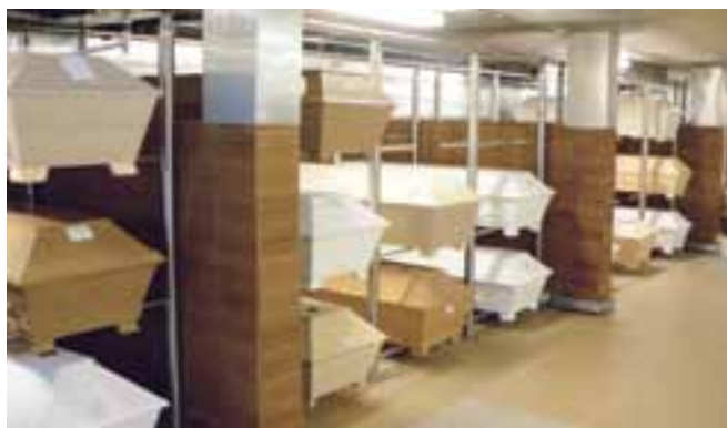
En Suède, les corps sont mis en cercueil en attente, dans un immense frigidaire du cimetière qui appartient à la ville. En moyenne, les corps y séjournent 28 jours. Après être allé à l'église, le corps revient au cimetière pour être incinéré la plupart du temps (80%) et mis en terre ou en columbarium.

Je retiens de cette mission que le mouvement coopératif peut prendre différentes formes : les coopératives funéraires suédoises n'ont pas de salon d'exposition, ne font pas de thanatopraxie, n'ont pas de crématoriums, même si elles font plus de 80 % de crémation, opèrent dans de petits bureaux minuscules et, malgré tout, elles répondent très bien aux besoins de leurs membres, car c'est le modus operandi des entreprises funéraires dans ce pays. Il importe donc de toujours bien connaître les besoins des membres et d'essayer d'y répondre du mieux possible.