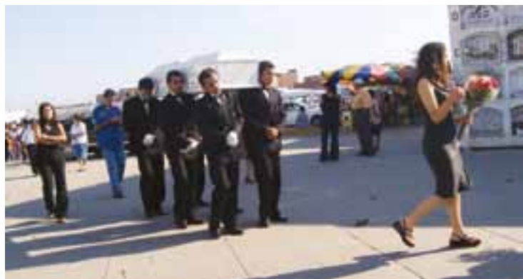
Cortège avec les porteurs et le cercueil lors de funérailles péruviennes

Nous y avons découvert un réseau coopératif très bien structuré. Issu des coopératives d'alimentation, ce mouvement était au départ des coopératives individuelles et une fédération très similaire à ce que nous connaissons au Québec. Avec les années et les fusions, le mouvement s'est regroupé à l'intérieur d'une seule organisation présente un peu partout en Suède et aussi en Norvège. Le réseau contrôle maintenant plus de 28 % du marché.