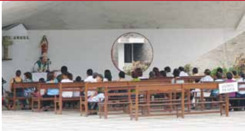
Célébration de funérailles au Pérou

En 2008, inspirés par tout ce que nous lisions sur l'industrie funéraire britannique, nous avons formé une petite délégation pour aller visiter quelques coopératives funéraires de l'Angleterre. Ces coopératives, Co-op Group et Midcounties, font partie de plus grandes coopératives de consommateurs multiservices qui comportent aussi des pharmacies, des stations-service, des agences de voyages, des marchés d'alimentation, et bien d'autres choses. Nous en avons rapporté beaucoup d'idées sur les cimetières écologiques, la publicité, la formation du personnel et les communications avec les membres. L'année suivante, c'est un représentant de Co-op Group qui venait visiter quelques coopératives d'ici afin de s'inspirer de nos installations, plus élaborées que dans les salons funéraires anglais.