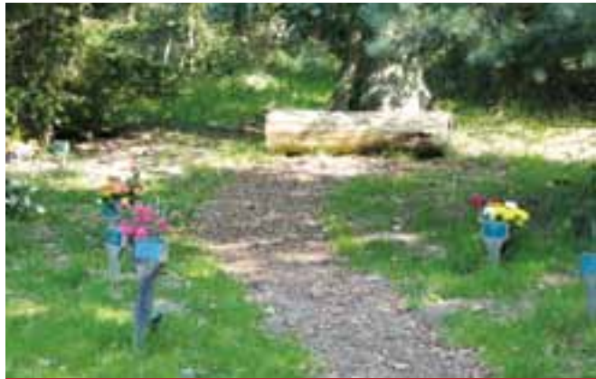
Cimetière écologique anglais. Les emplacements des tombes sont indiqués avec des « marque-place » en granit qui remplacent les pierres tombales. Les sentiers boisés conduisent les visiteurs d'un emplacement à l'autre.

Si la coopération entre les membres permet de grandes choses, imaginez lorsque cette coopération s'incarne entre les coopératives : on assiste alors au déploiement de toutes nos forces.